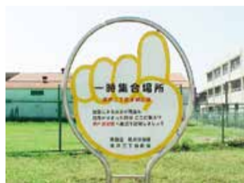
一時集合場所 临时集合地点