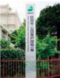
避難場所 避難地点