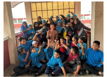
2024 年度派遣時の様子

葛飾区の代表として、マレーシア・パナン州で ホームステイと現地での交流活動を行う派遣団員を募集します。 多様な文化がおりなす社会で生きる活気あふれる人々との交流で学び、 帰国後は葛飾区の国際交流・多文化共生事業に協力していただきます。